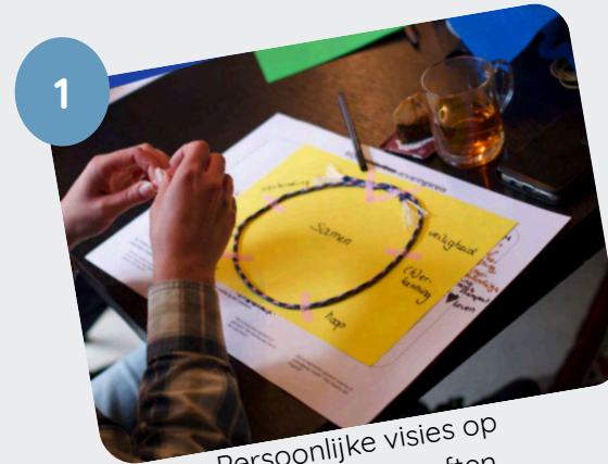
1 Persoonlijke visies op basis van behoeften